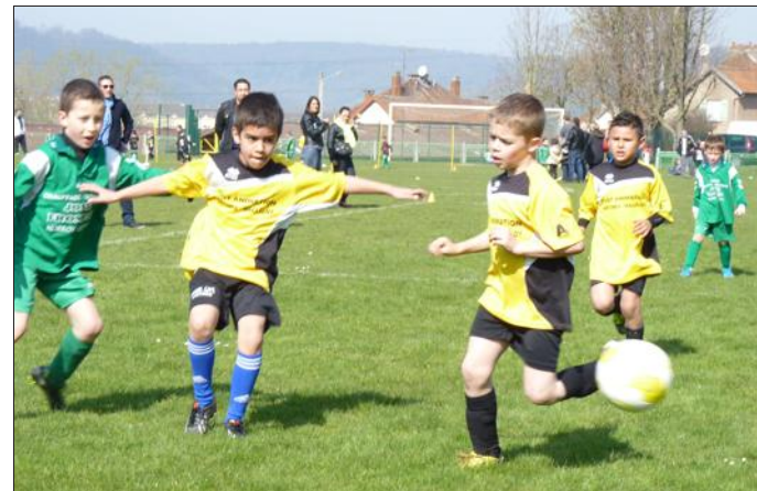
■ Ici, pas de classement, seulement la satisfaction d'avoir dompté le ballon...

Avec les beaux jours qui reviennent, les plateaux débutants ont retrouvé les pelouses des stades et notamment celle du stade de Clévant à Custines. Samedi, le club de