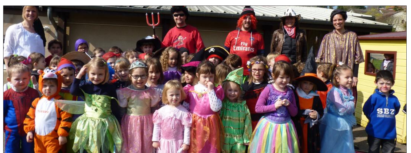
■ Heureux, les petits de la maternelle !

Dans la cour de l'école : les princesses, pirates, superhéros, sorcières, chevaliers et autres lutins célébraient ce carnaval 2014 dans une ambiance des plus festives.